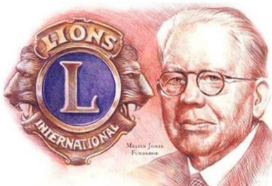
Oprichter Melvin Jones (1879-1961)